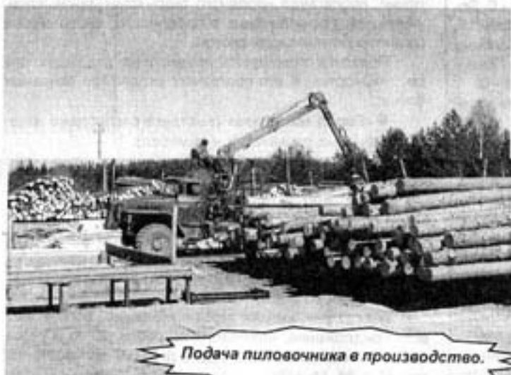
Подача пиловочника в производство.

число поставщиков. Помимо Москвы, Кирова, Костромы, Макарьевский ДОЗ получает сырье и комплектующие из Кадья, Кологрива, Георгиевского, Балабанова, а шпон, лак - из Италии. Это значит, что ДОЗ обеспечивает дополнительные рабочие места и в этих муниципальных образованиях. Продукция Макарьевского ДОЗа охотно раскупается в Москве, Костроме, Ярославле, Иваново, Буре, Кинешме, Тольятти, Волгограде. Планируется на предприятии сделать склад шпона, чтобы потребители из близлежащих регионов могли им пользоваться, не гоня транспорт в Москву.