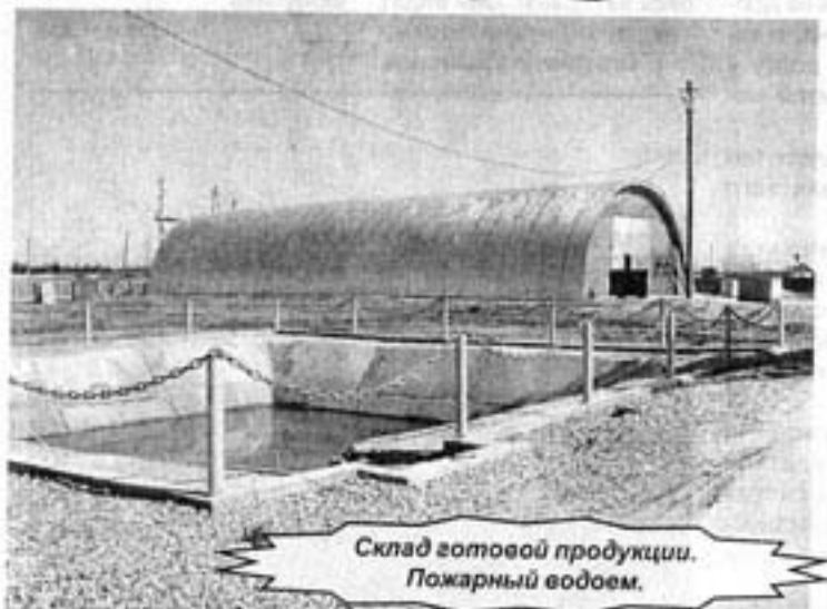
Склад готовой продукции. Пожарный водоем.