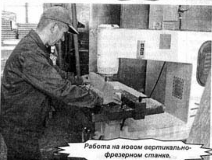
Работа на новом вертикально-фрезерном станке.