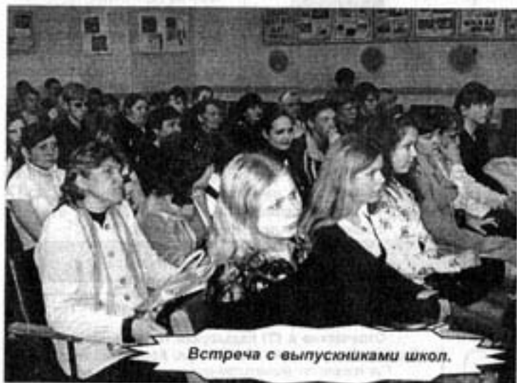
Встреча с выпускниками школ.